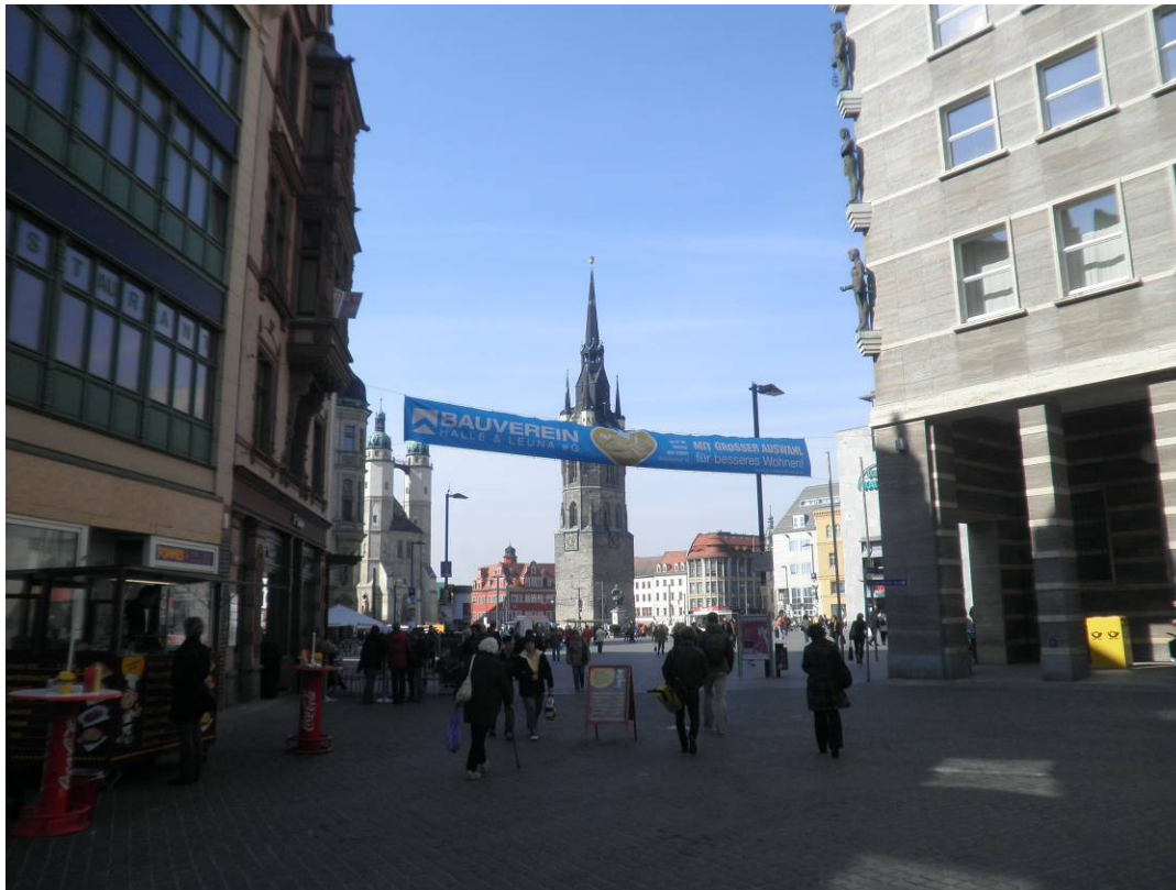
Kommerzielle Werbung (unerwünscht)