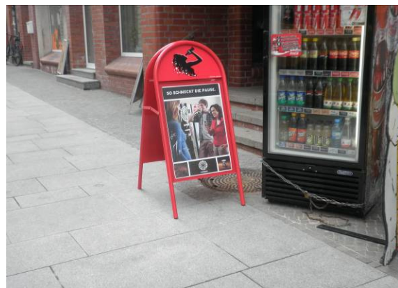
Diese Arten der Werbeträger sollen langfristig nicht mehr verwendet werden