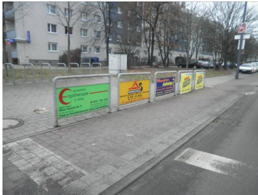
Werbetafeln in unterschiedlichen Größen montiert