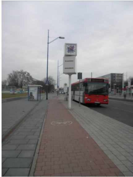
Zifferblatt für Werbung genutzt