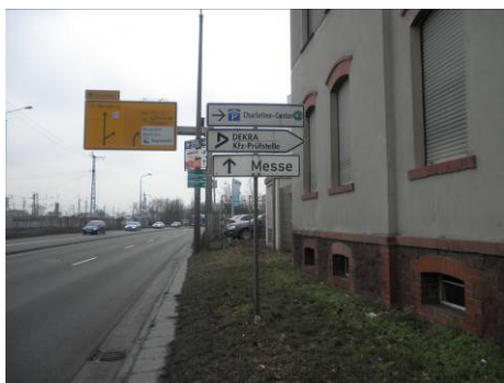
Fülle von Einzelschildern Volkmannstraße – Bedarf für Sammelaufsteller