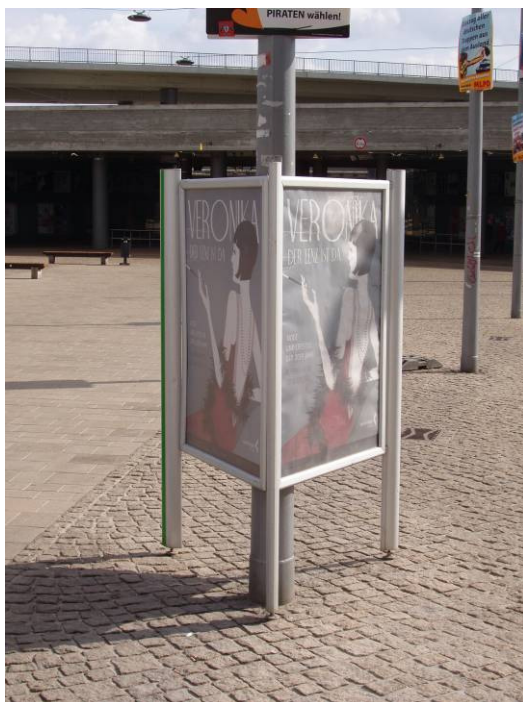
City- Aufsteller mit Kulturwerbung