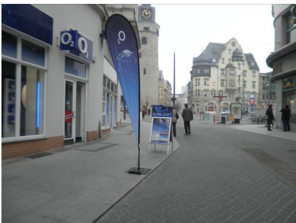
untere Leipziger Straße