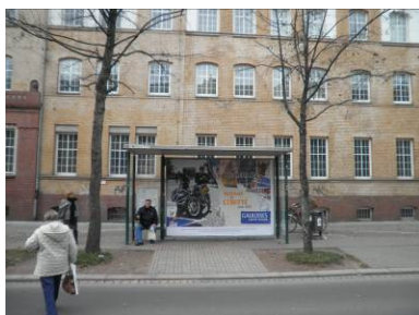
Großflächen in speziellen (hohen) Fahrgastunterständen