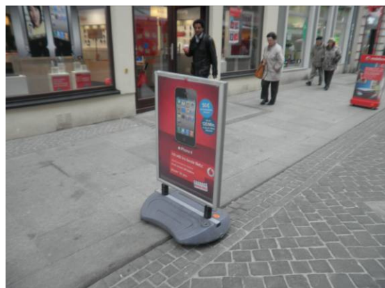
Diese beiden Arten Geschäftsaufsteller sollen bevorzugt weiterverwendet werden