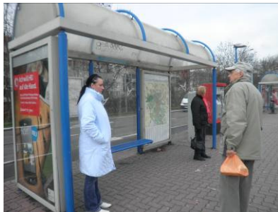
Runddach (hier mit Stadtplan ausgestattet) auf HAVAG-Grundstücken (eigenes Gleisbett für Straßenbahnen)