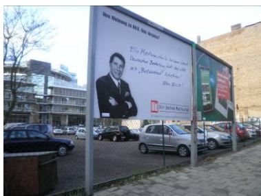
Großflächentafeln unbeleuchtet, Wandmontage oder freistehend