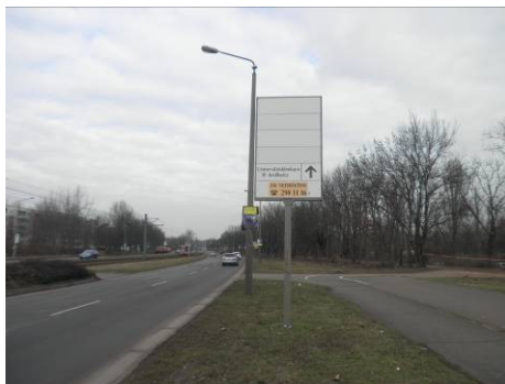
kaum belegt (überflüssig)