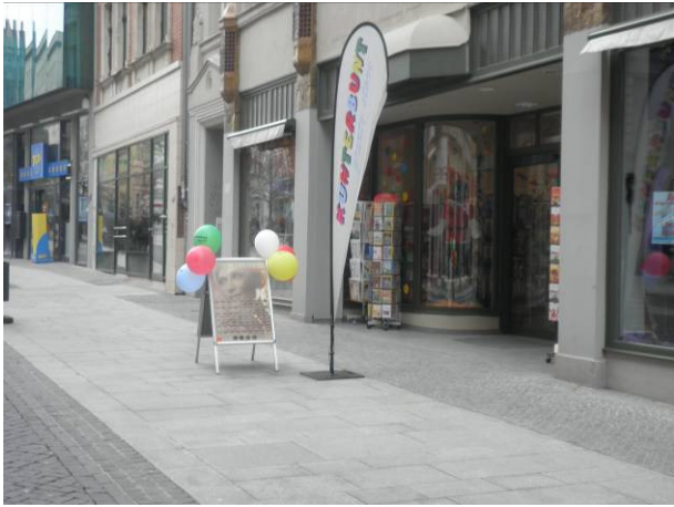
obere Leipziger Straße