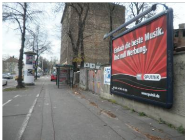
Großflächentafeln beleuchtet, Wandmontage oder freistehend