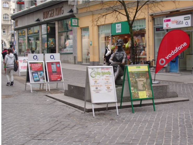
Kunst und Werbung in Konkurrenz