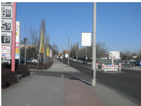
Rückseite der Seitenausleger