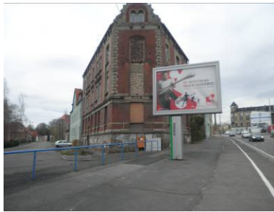
MegaLight –hinterleuchtet, verglast, mit wechselnden Bildern