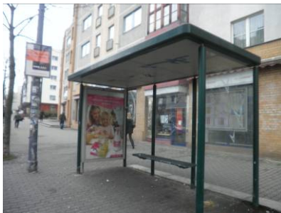
gerades Dach (Xenon bzw. Hochrenk) im gesamten Stadtgebiet