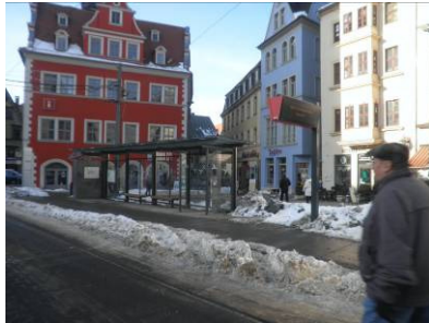
Altstadttyp, ohne Werbevitrinen im Bereich der hist. Altstadt