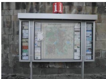
Stadtplaninformationsanlage (Sonderform, zukünftig nicht mehr)