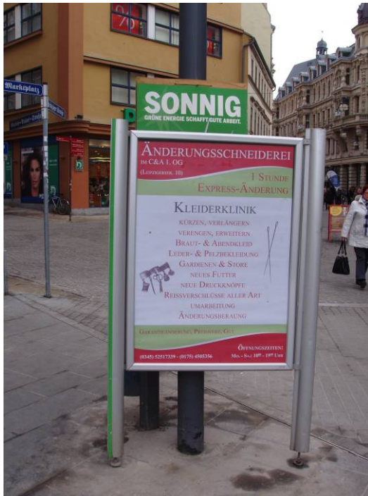
City- Aufsteller mit (nicht erwünschter) Produktwerbung