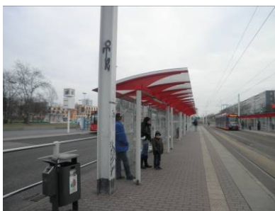
Sondertyp Straßenbahn Neustadt auf HAVAG-Grundstücken (eigenes Gleisbett für Straßenbahnen)