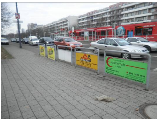
Werbetafeln in unterschiedlichen Größen montiert