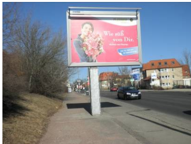
Großflächentafeln beleuchtet auf Monofuß (Citystar)