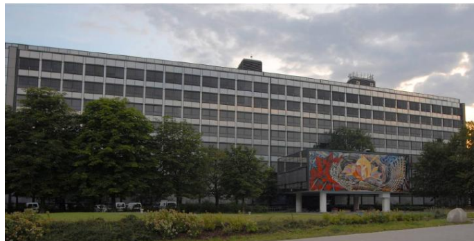
3. OG – NGF ca. 1.220 m 2