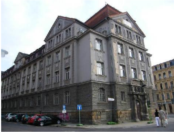
Fassade zum Hallmarkt 2010