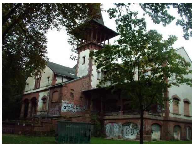
Das Peißnitzhaus von Südosten