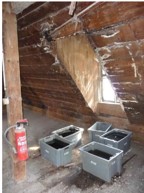
Schwammbefall im Dachbereich