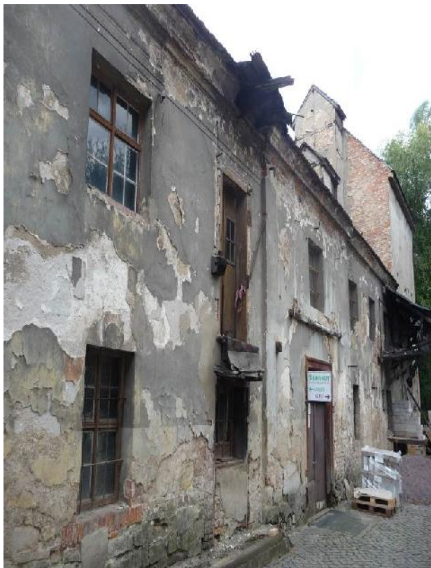
Mühlhauptgebäude von Südosten 2015