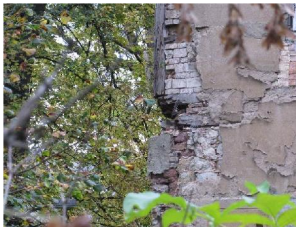
Schäden am konstruktiven Gefüge