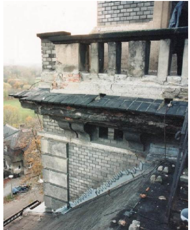
Schäden am Turm