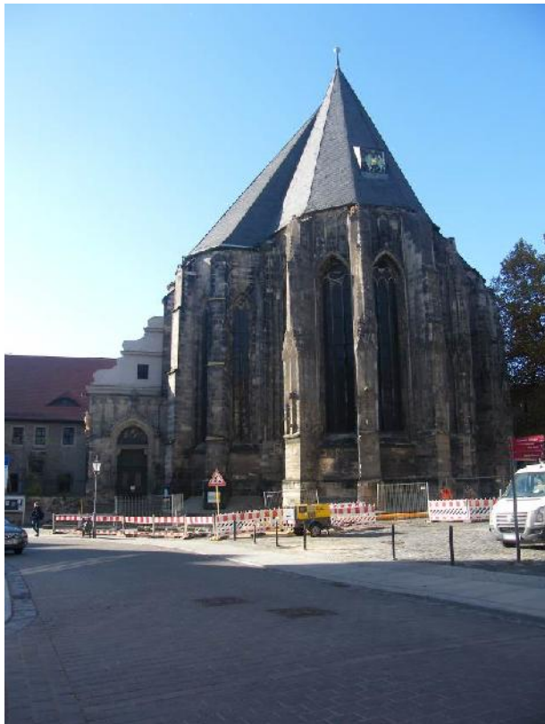
Die Chorfassade der Moritzkirche 2015