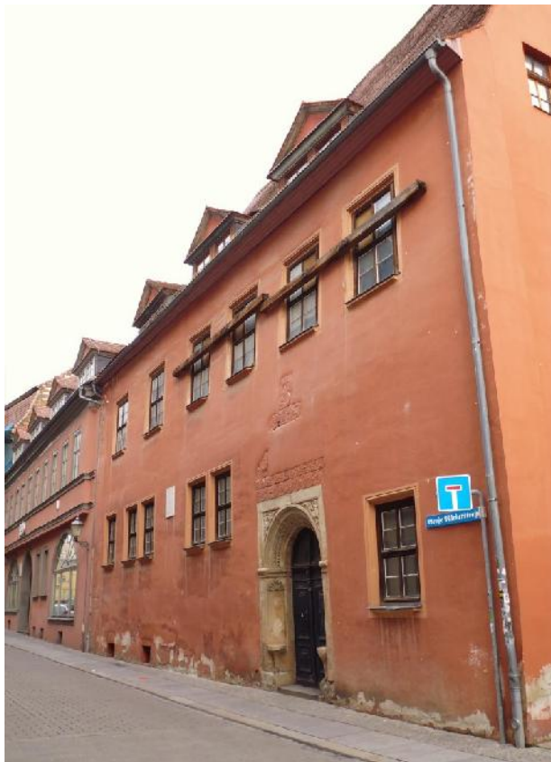
Das Baudenkmal von Südwesten