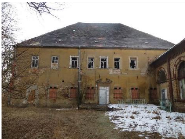
Das alte Herrenhaus im heutigen Zustand