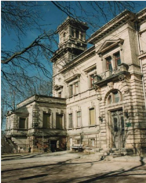
Fassadenansicht der Villa Lehmann 1998