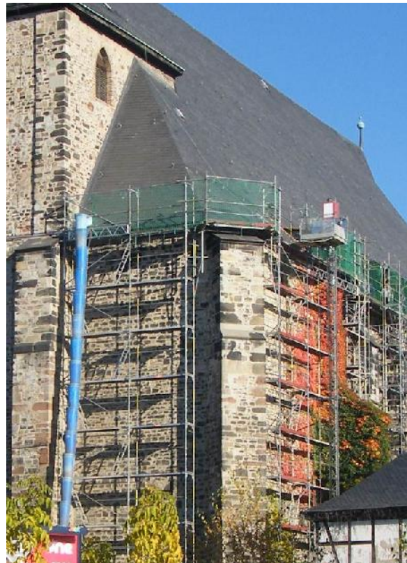
Aktuelle Sanierungsarbeiten an der Traufe

Kirche („Moritzkirche“); ehemalige Augustiner-Chorherrenstiftskirche St. Moritz, heute katholische Pfarrkirche St. Mauritius und Paulus; dreischiffige, spätgotische Hallenkirche mit unvollendeter Turmfront und reich gestalteter Chorpartie von starker architekturplastischer Reliefwirkung; der Bau markiert den Durchbruch der spätgotischen Architektur in Mitteldeutschland; Baumeister war Conrad von Einbeck, von ihm bis gegen 1420 die vier östlichen Joche des nördlichen Seitenschiffs, die nördliche Nebenapsis mit dem Gewölbe und die vier anschließenden Polygonseiten der Hauptapsis; 1472 Weihe der östlichen Kirchenhälfte, die übrige gesamte Einwölbung der Kirche erst 1554-57 durch Nickel Hoffmann