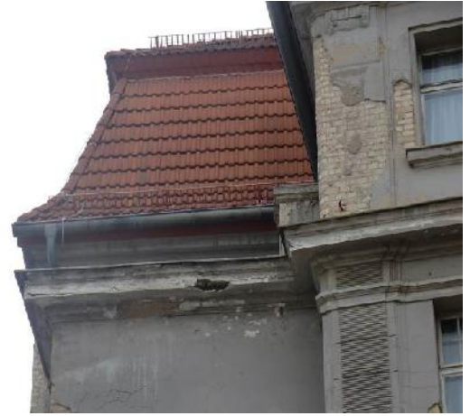
Schäden an Fassaden und Traufe