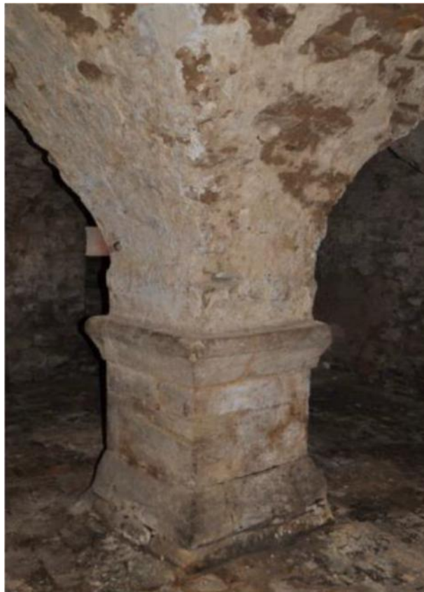
Blick in das romanische Kellergewölbe