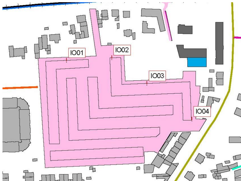
Abb. 2: Lage der Immissionsorte