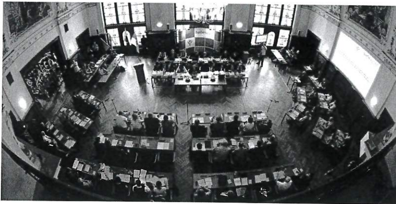
Der Stadtrat tagt im Ratshof in Halle.

Von Tanja Goldbecher | 27.03.19, 06:00 Uhr