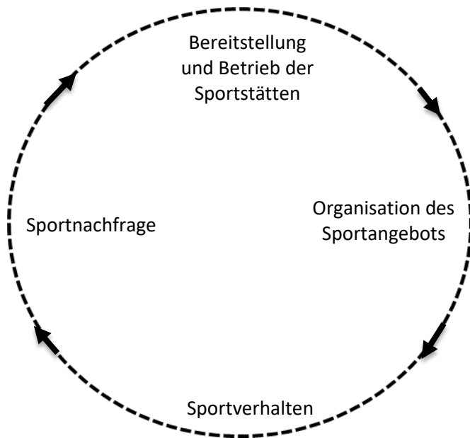
Abbildung 1: Kreislauf der Sportentwicklung